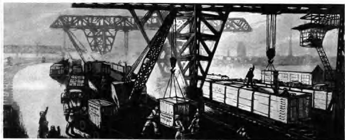
(上) 车站早晨 (套色木刻)