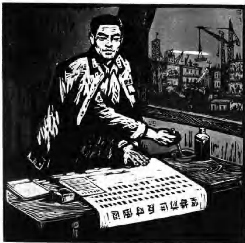
夜不能寐 (套色木刻)