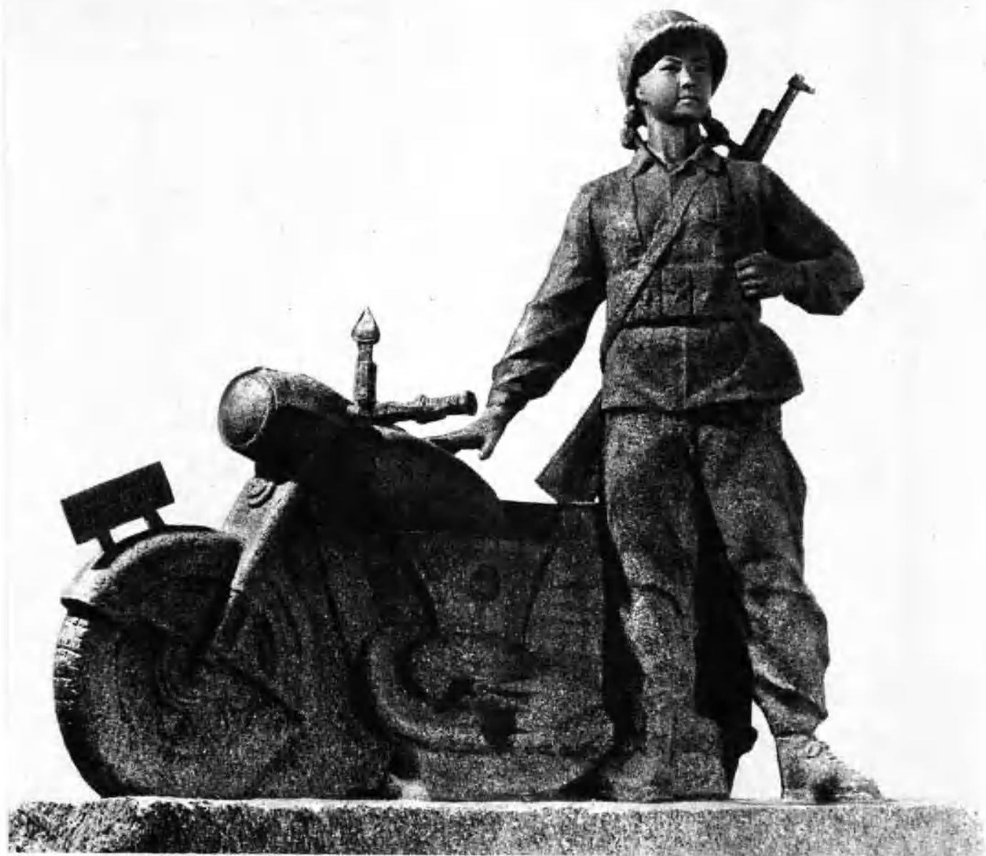
时刻听从党召唤（雕塑）