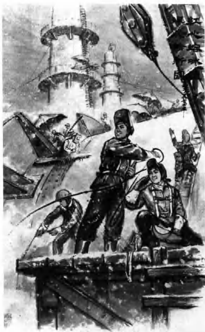
红心熔冰雪 焊枪绘新图 (中国画)