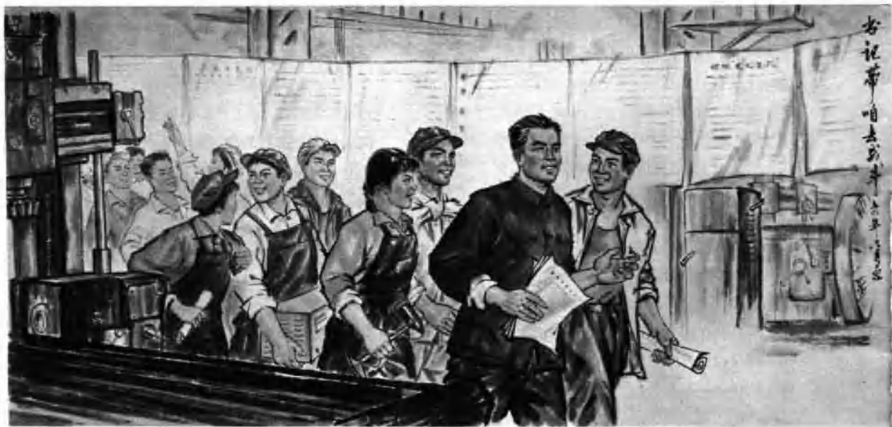
书记带咱去战斗 (中国画)