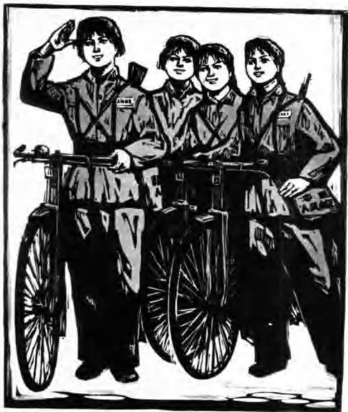
值勤归来 (套色木刻)