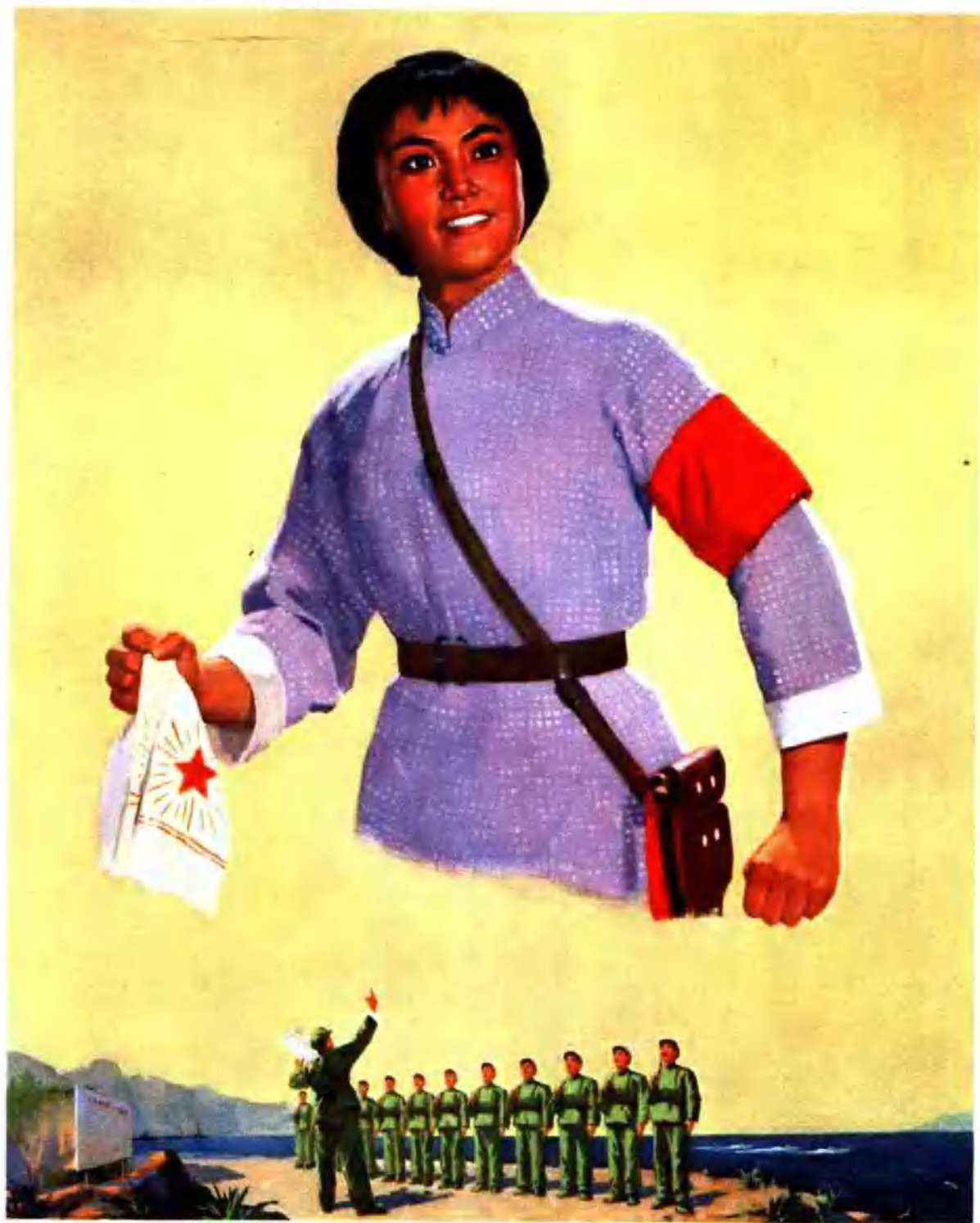
学英雄见行动 (杜鹃山)(水粉画)