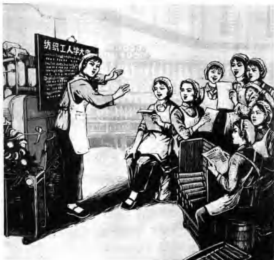
战歌阵阵 (套色木刻)