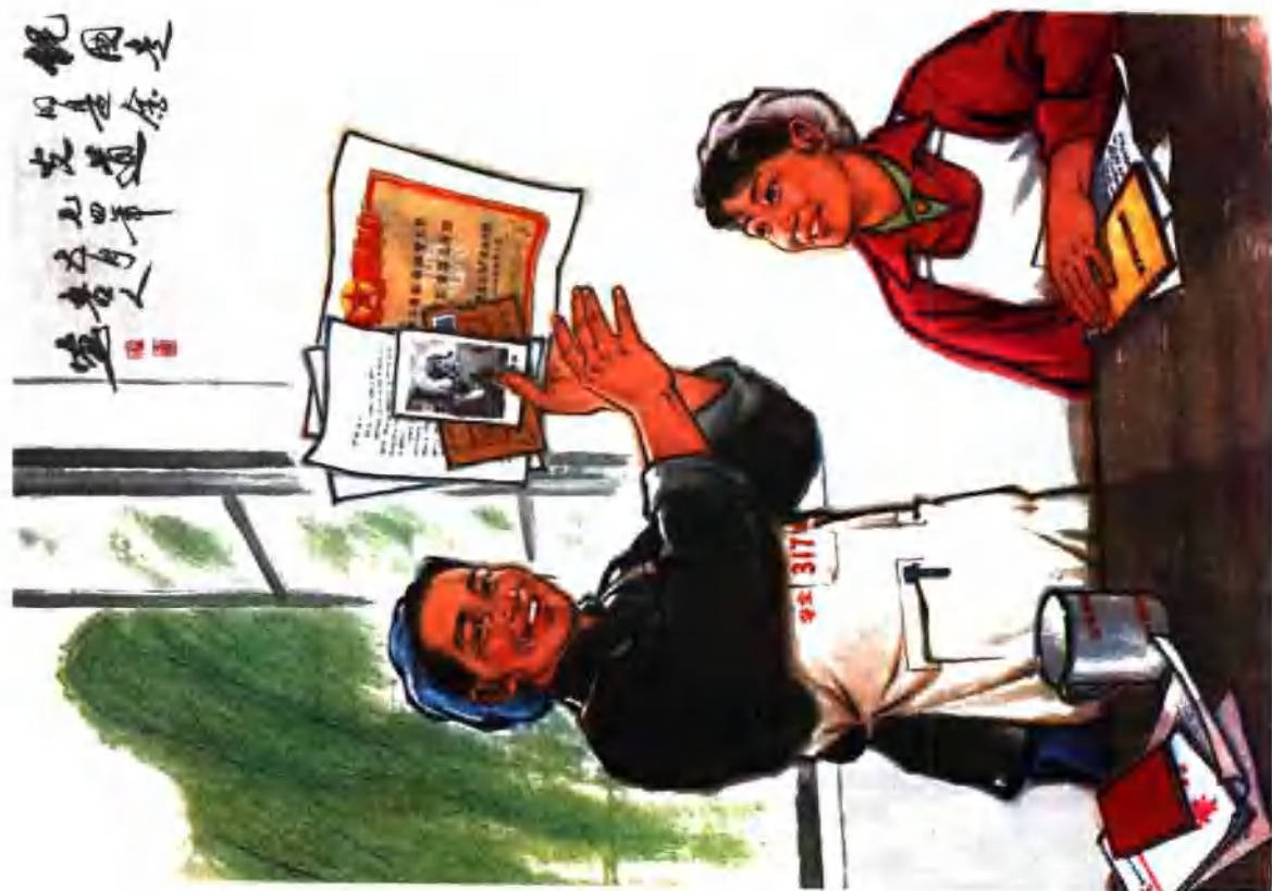
党生日是金光道 (中国画)