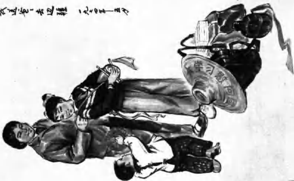
我送爸爸去边疆 (中国画)