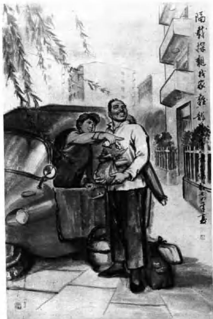
隔载探亲找家“难” (中国画)