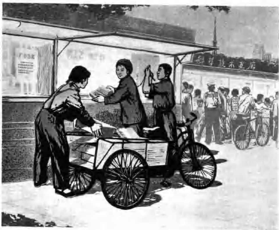
我厂又一新项目 (套色木刻)