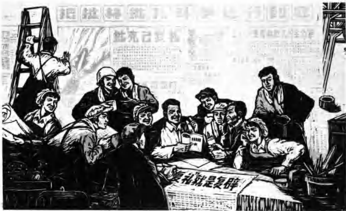
认真学 深入批 (套色木刻)