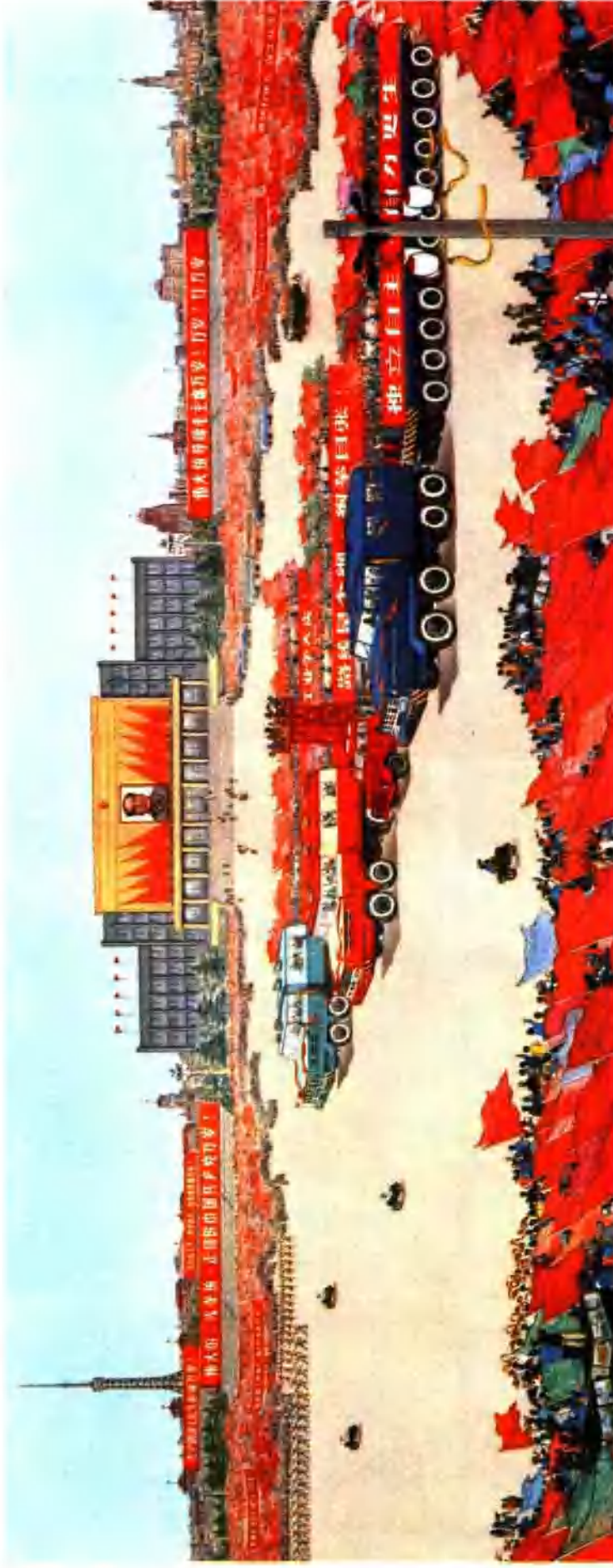
运输战线添骏马（中国画）